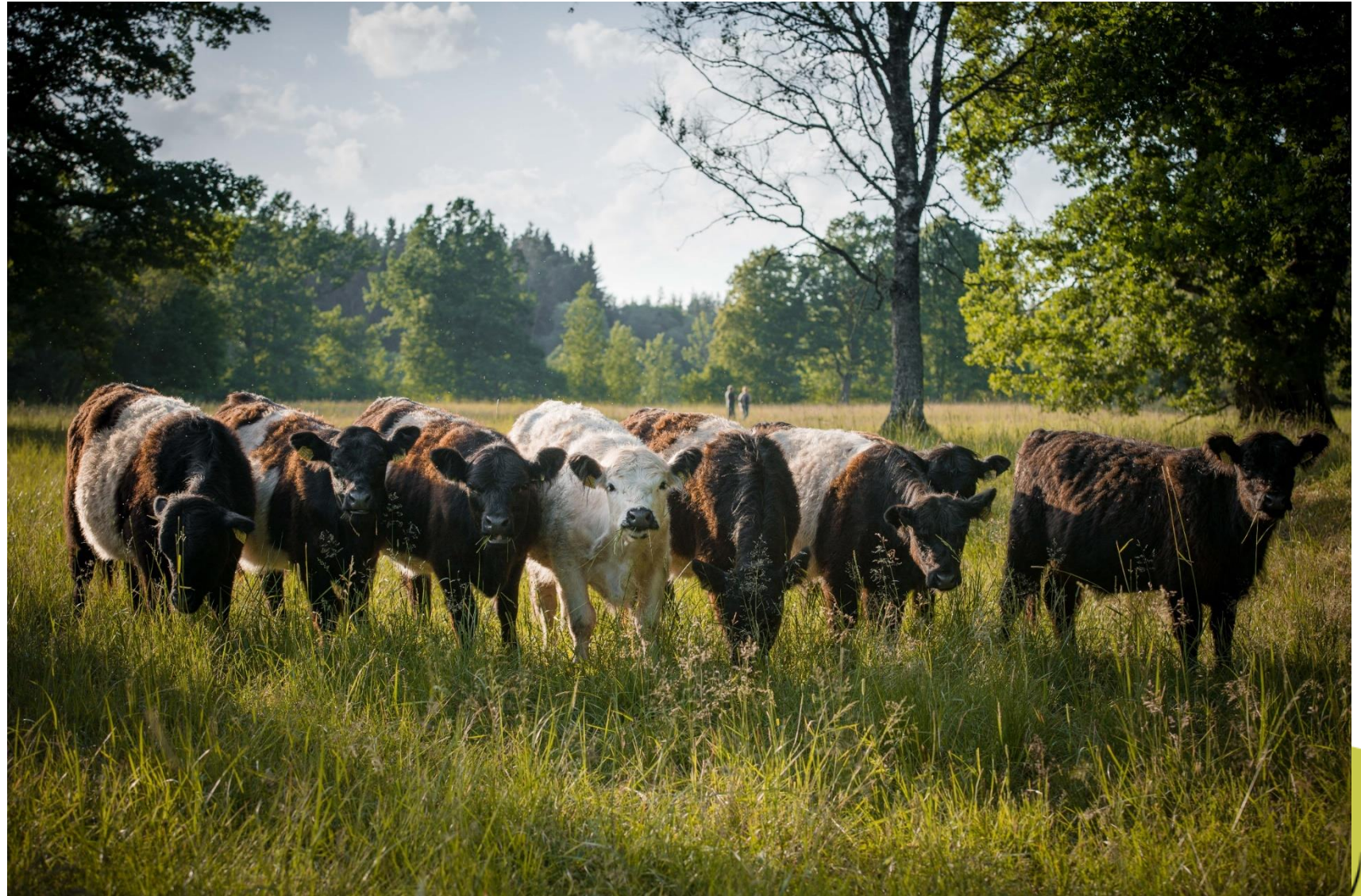
Mobilais ganāmpulks Valkas novada Marsos, parkveida ainavas atjaunošana